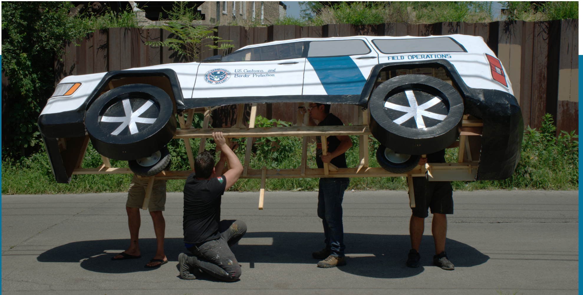
A sculpture from The Last Judgment erected in July in Little Village by Artsumex artisans.

Creatively drawing on Mexican traditions and artistry to celebrate the solidarity and resilience of Little Village residents, Adela Goldbard's The Last Judgment is an immersive installation of large-scale sculptures and sound, designed as the central features of a public firework performance in Little Village.