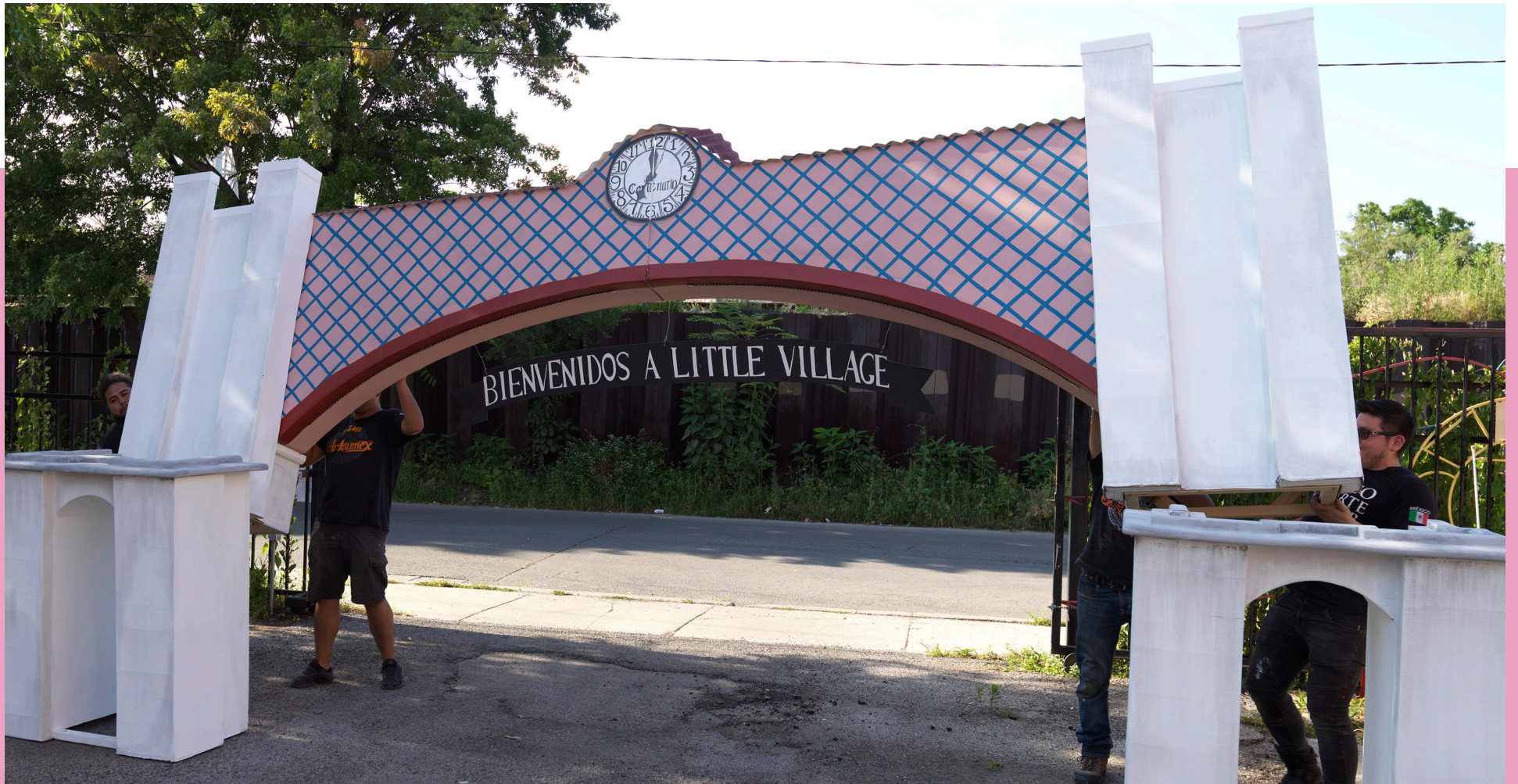
Una escultura de El Juicio Final erigida en julio en La Villita por artesanos de Artsumex.

Recurriendo creativamente a tradiciones y arte mexicanos para celebrar la solidaridad y resiliencia de los habitantes de La Villita, El Juicio Final de Adela Goldbard es una instalación inmersiva de sonido y esculturas a gran escala diseñados como elementos centrales de un performance pirotécnico público que tendrá lugar en octubre en La Villita.